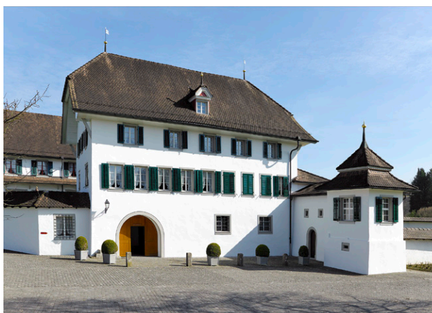
Bechtigerhaus des Klosters Frauenthal in Cham, 1609 durch Jost Knopfli d. J. errichtet. Das Haus ist Wohnsitz des Spirituals oder Bechtigers des Frauenklosters, dem ältesten Zisterzienserinnenkloster der Schweiz.