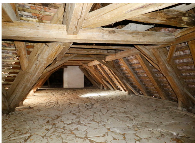
Gebäude im Kanton Zug mit Dachstuhl aus dem Jahr 1495. Der liegende Dachstuhl beeindruckt durch seine Grösse und Konstruktionsweise. Das spätmittelalterliche Gebäude ist ein anschauliches Zeugnis spätmittelalterlicher Baukunst und ist daher auch für die Forschung von Bedeutung.